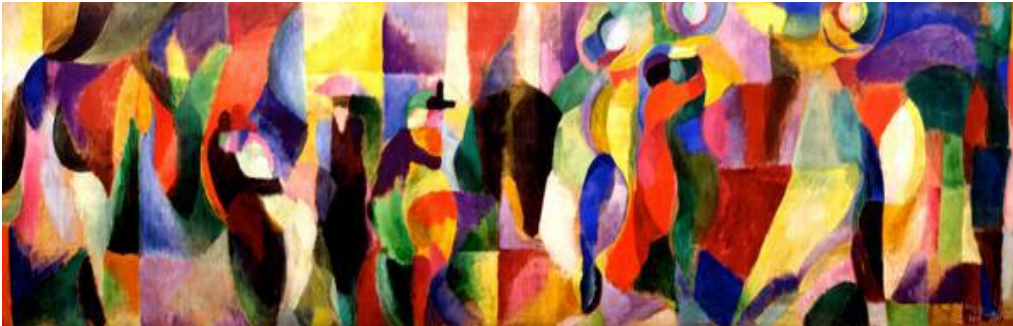
« Rythmes » de Sonia DELAUNAY

jeudi 30 janvier de 9H30 à 12H30 – 14H à 17H