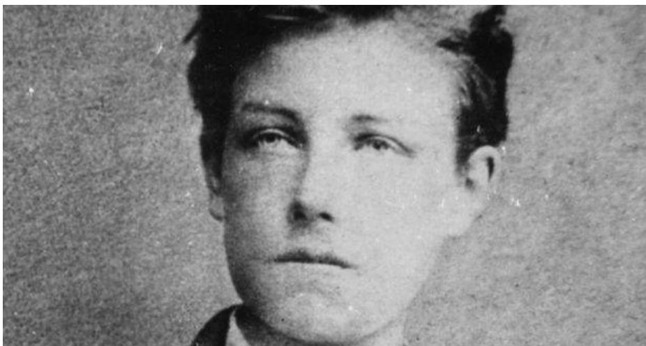
Arthur Rimbaud à 17 ans en 1871

Chaque jour, nous prendrons le temps d'un bon échauffement en chœur. Plusieurs exercices seront proposés pour que chacun puisse trouver les outils dont il a besoin pour s'épanouir en confiance dans cet art du chant choral. C'est de ce moment d'attention à soi, à son corps en rythme, à sa voix et ses métamorphoses, aux autres qui résonnent en soi et hors de soi, à l'harmonie qui se crée dans le mouvement du chœur que le travail d'interprétation prend sa source : perméabilité et concentration, polarité créatrice, ... c'est l'ossature du stage.