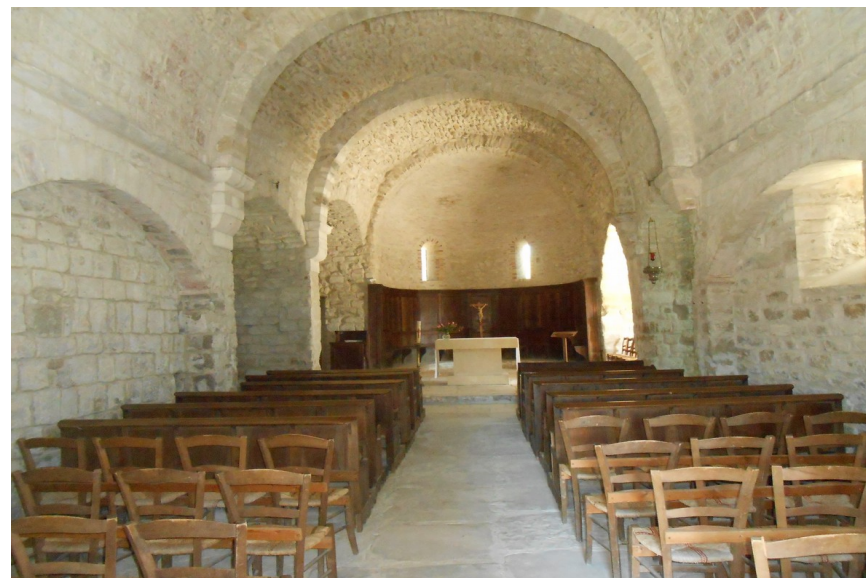
Chapelle de Piégon

Chaque matin, nous prendrons le temps d'un bon échauffement en chœur. Plusieurs exercices seront proposés pour que chacun puisse puiser les outils dont il a besoin pour s'épanouir en confiance dans cet art du chant choral. C'est de ce moment d'attention à soi, à son corps en rythme, à sa voix et ses métamorphoses, aux autres qui résonnent en soi et hors de soi, à l'harmonie qui se crée dans le mouvement du chœur que le travail d'interprétation prend sa source : perméabilité et concentration, polarité créatrice, ... c'est l'ossature du stage.